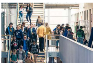
Škole i vrtići